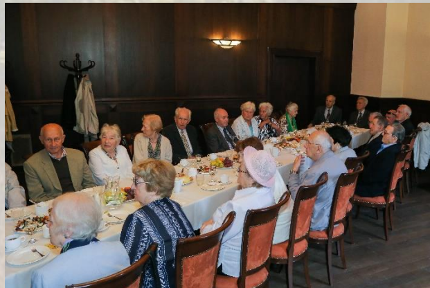
17 czerwca 2015 r. Spotkanie Seniorów